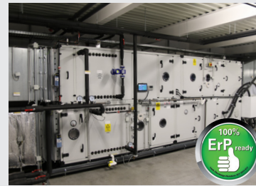
Egy légekezelőgépbe épített Rosenberg HKVS nagyhatékonyságú közvetítőközegező hővisszanyerő rendszer, akár 80% száraz termikus hatásfokkal